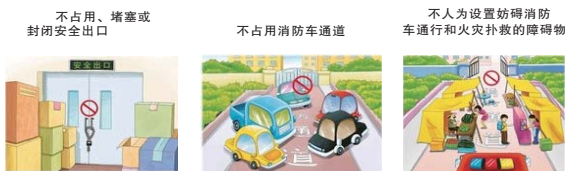
不占用、堵塞或封闭安全出口