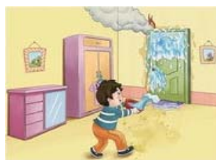
大火封门无法逃生时，可用浸湿的毛巾、衣物堵塞门缝泼水降温