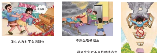
发生火灾时不贪恋财物