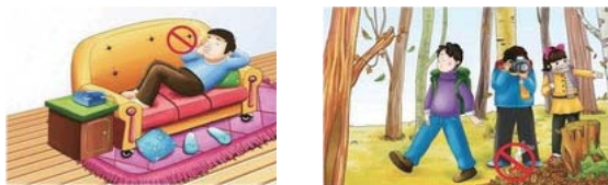
不躺在床上或沙发上吸烟