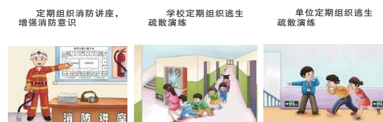
定期组织消防讲座，增强消防意识