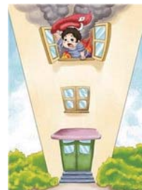
大火封门无法逃生时，在窗口抖动鲜艳的衣物发出求救信号等待救援